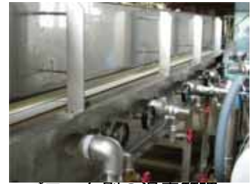
ブロック別の温度管理